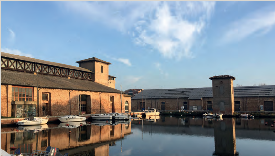
Magazzino del Sale Torre e Magazzino Darsena