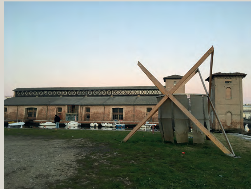
Area all'aperto antistante la chiesa di Sant'Antonio